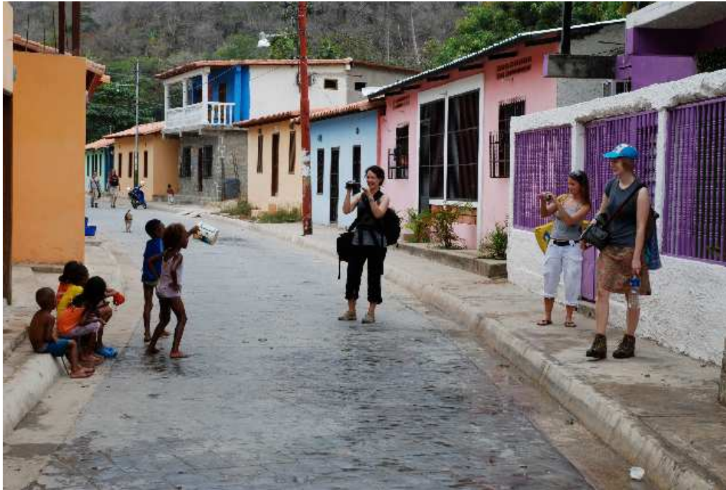
Ein Reise- bericht von Michael Dörner

Unter dem viel versprechenden Titel: „Mücken drücken und Kröten lecken – Kunststudierende der Fachhochschule Ottersberg auf den Spuren Humboldts in Venezuela“ ging es nach langer Vorbereitung am Dienstag den 23. Februar endlich los.